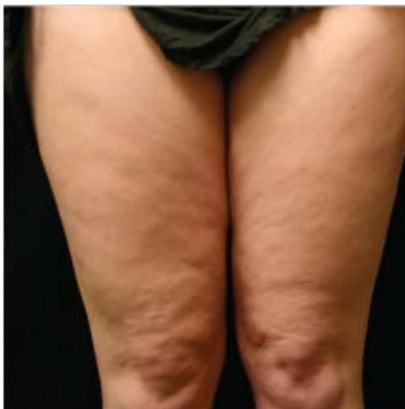
Antes 5 de mayo del 2006