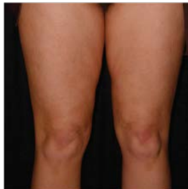
Después 25 de mayo del 2006