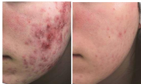
Acné, después de 6 sesiones