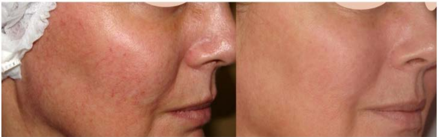
IPL Photorejuvenation – 4 Treatments