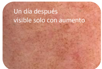
Un día después visible solo con aumento