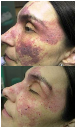
Antes y después de 8 tratamientos