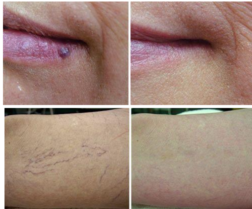
Antes y después de un tratamiento