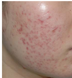
Acné, después de 6 sesiones